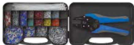
625 TERMINALI A BUSSOLA + PINZA 537 COD. 80405