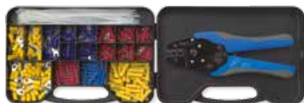
225 CAPICORDA + PINZA 534 COD. 80401